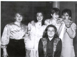
Банкет с ССО Одиссей