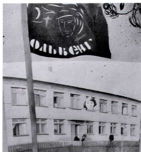
Первый эскиз эмблемы отряда