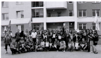
День строителя на целине 2012 года