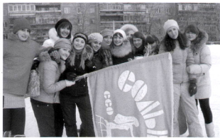
3 место в соревнованиях по хоккею