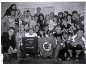
Знакомство с ССО «Энергия» (г. Барнаул)