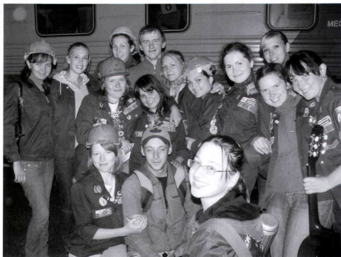
Возвращение с целины