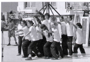
День строителя – танец с ССО «Каравелла»