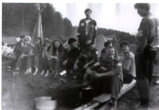
Знаменка 1992 с ССО ЭСТО