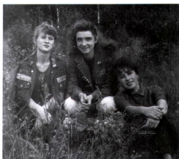
Молодые и командир, целина 92 г.