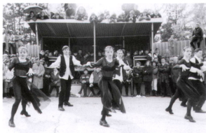
Звездник 97 с Одиссеем