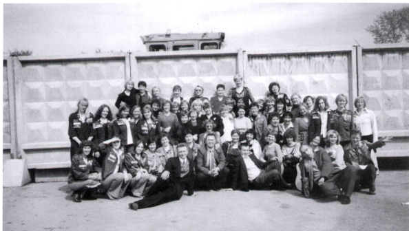
Юбилей 30 лет ССО Сольвейг

Временные трудности, приносившие немало беспокойства, мы преодолевали вместе. Когда становилось невмоготу – брали гитару, выходили во двор и радовали уставших и измученных работяг звонкими девичьими голосами. Радовались и сами, подбадривая себя: все равно все будет хорошо. Иначе не может быть.