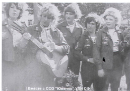
Вместе с ССО "Ювенево" УИИ СФ