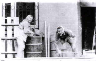
Коттеджи в Токарево, база Черданцево