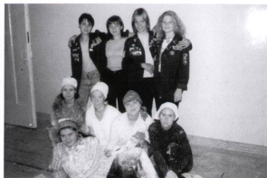
Целина 2000 (объект: НИИ ОММ)