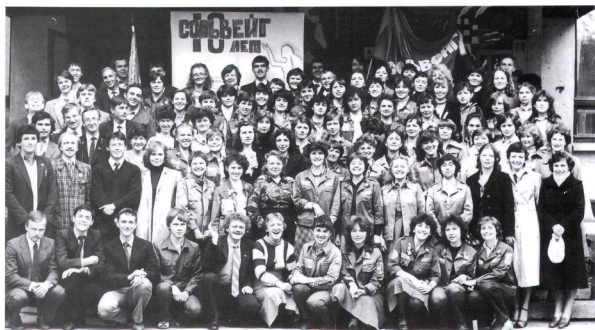
10 лет ССО Сольвейг в гостях ССО Гренада