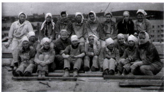
Перекур на крыше