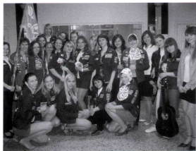
День рождения – 38 лет