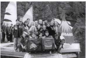
Знаменка – 23 с СОП “Эскорт”