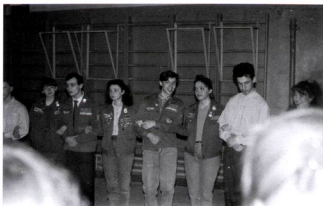
Агитка с ССО Импульс