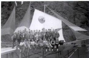
Знаменка 97 с Одиссеем