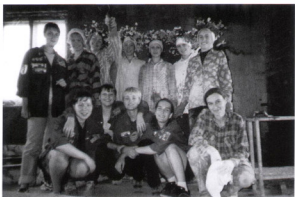
Первая стенка на целине 2000 (объект: коттедж в Краснoлeсье)