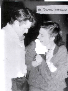
Кандидатская агитка с Вегей 1991 г.