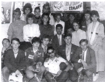
Дежурство в гардеробе на стройфаке

Целина продолжилась и осенью. В сентябре небольшая бригада «Сольвейг» была отправлена в Бисерт на отделку коттеджа, построенного «Гренадой».