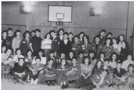
Агитка с Вегой 1992, г. Екатеринбург, р-он Химмаш

С юбилеем ССО Сольвейг! Удачи, и дальнейшего роста и процветания!!!