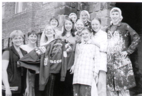
В гостях у девочек на объекте на целине