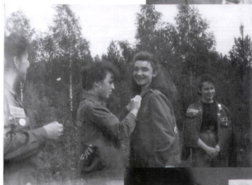
Вручение первого целинного значка