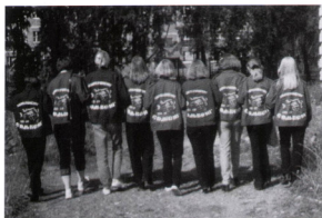
Целина 2001 (Первоуральск)

Было очень много знакомств с чаем и не только, зимой катались на линолеуме с горок на Уктусе и больно отбивали попы, как обычно поздравляли отряды дружественные и не очень дР и юбилеями, ходили на спевку в ГУК и конечно же по субботам на Радиофак