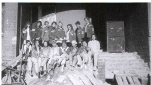
Целина 97 после Анархии.