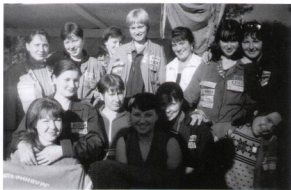
Знаменка 2001 г., к нам пришел в гости ССО «Родник» (Н.Тагил)