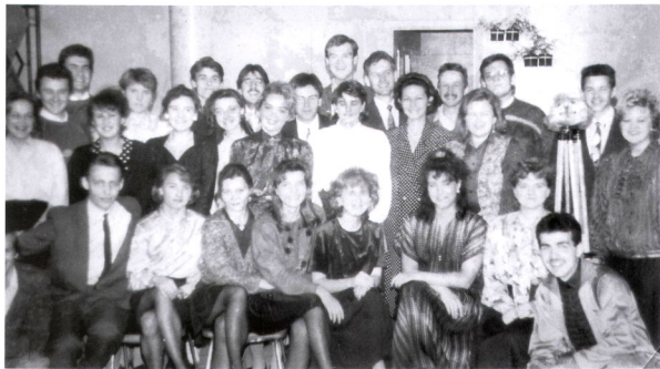
Банкет с ССО Одиссей, октябрь