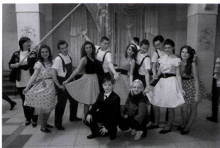
Мариинка с ССО «Прометей»