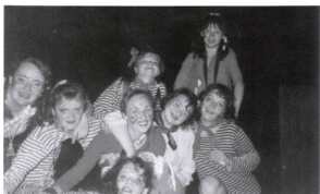
Целина 97 Анархия