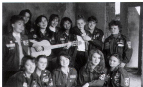
Целина 96 - и снова, снова, снова...