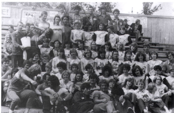
С ССО «Ермак»