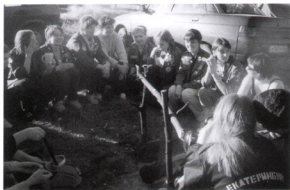
Знаменка 2001 г., к нам в лагерь пришли наши старушки