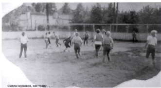
Схватки мужиков, как тобою.....