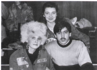
Агитка с ССО Одиссей

Объект: жилой 9-этажный дом на Елизавете. Затирка и штукатурка стен и потолков.