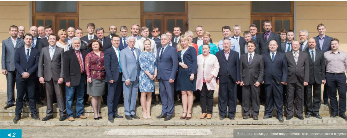
Большая команда производственно-технологического отдела

Производственно-технологическому отделу УЭХК – 70!