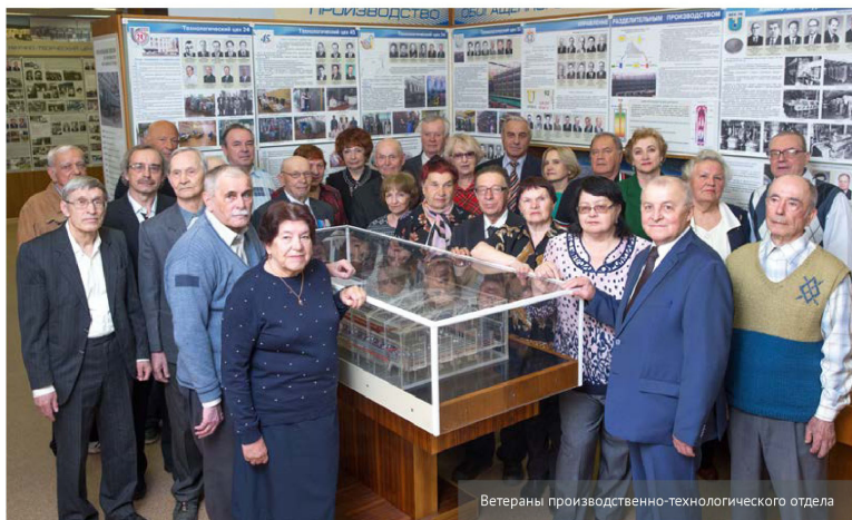
Ветераны производственно-технологического отдела

Хочу пожелать всем коллегам «юношеского здоровья», адаптивности (к ней в придачу – терпения), смелых идей, ну и, как РТЛщик, надежности и эффективности. А ветеранам отдела – всего того же плюс богатейского здоровья!