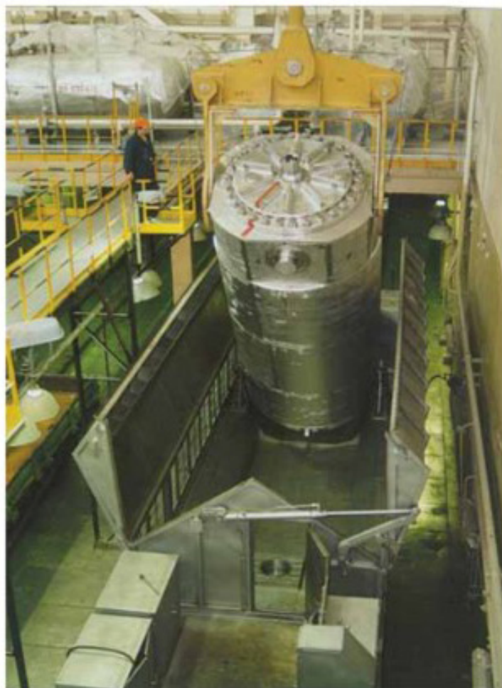
Разгрузка ОЯТ с железнодорожной платформы

После доставки ОЯТ в конечный пункт назначения его снова помещают в хранилище - для дальнейшего снижения уровня радиоактивности и тепловыделения.