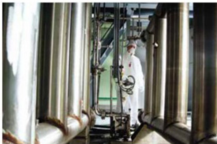
Изготовление порошка диоксида урана. Стадия 1

Остался всего один вопрос: для чего мы выделяли уран и плутоний из ОЯТ?