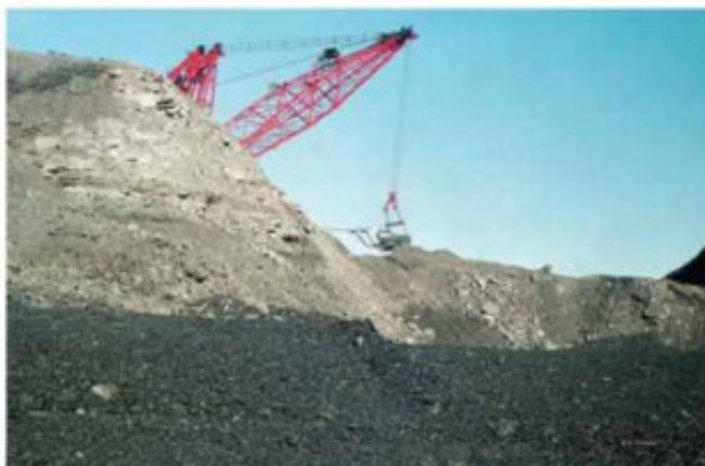
Добыча руды в карьере

Уран добывают шахтным способом, если в крепких горных породах залегают достаточно выраженные рудные жилы.