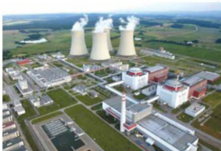
АЭС, г.Тимелин, Чехия

В течение этого периода в топливе происходит ядерная реакция деления и выделяется тепло. Вода, циркулирующая через активную зону реактора (т.е. омывающая твэлы), нагревается до высокой температуры и контактирует в парогенераторе с водой второго контура, которая, в свою очередь, испаряется. Пар направляется на турбогенераторную установку и вращает ее – так происходит выработка электричества на АЭС.