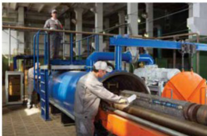
Циркониевое производство на ЧМЗ