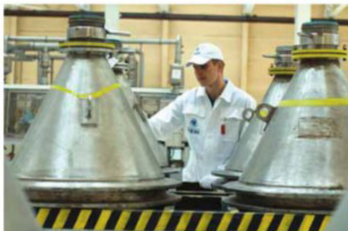
Изготовление порошка диоксида урана. Стадия 2

Ответ чрезвычайно прост – уран возвращается в ядерный топливный цикл в виде свежего топлива. Ведь после переработки уран теряет основную часть своей радиоактивности, становится практически безопасным и, значит, можно повторить (уже с его участием) все вышеописанные операции. Это вполне разумно, учитывая ограниченность запасов урана в России и на планете. По экспертным оценкам, разведанных руд урана хватит на 75-85 лет работы мировой атомной энергетики с учетом современных темпов ее роста.