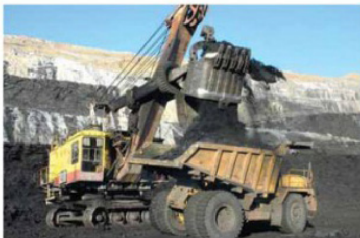
Погрузка в урановом карьере