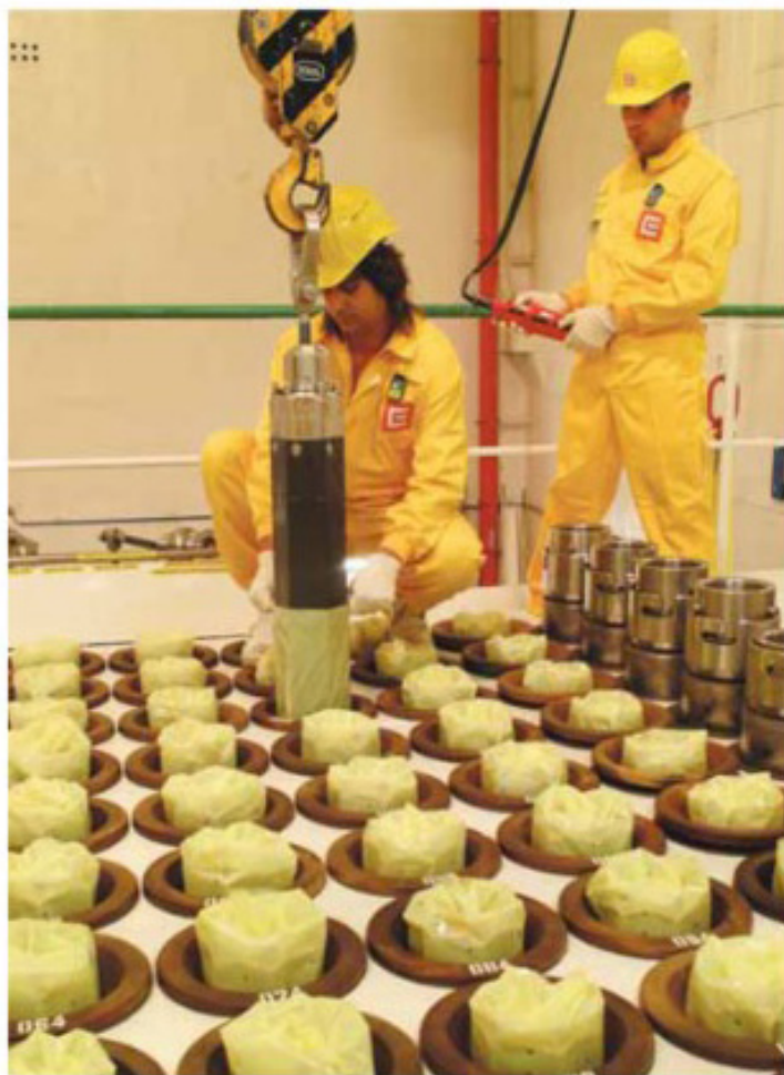
Загрузка топлива на АЭС Духованы, Чехия

Наконец, топливо попадает в реактор, где и «работает» несколько лет (для современных реакторов ВВЭР этот срок составляет 3 года и более, и называется топливной кампанией).