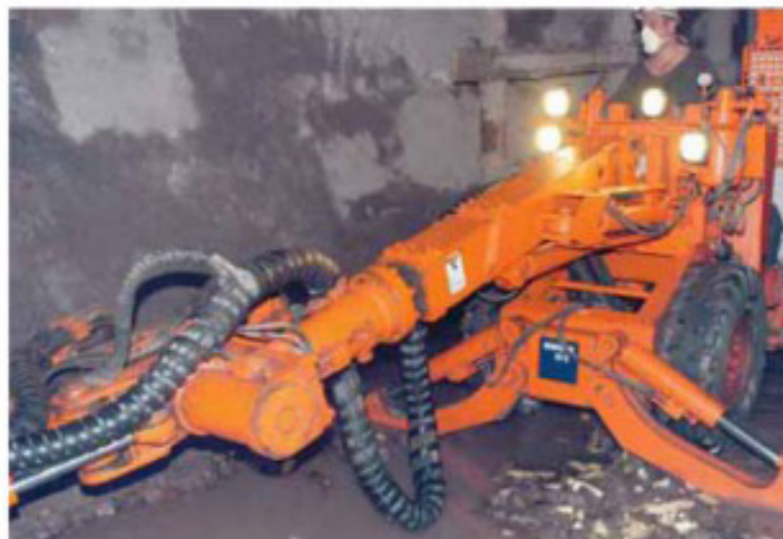
Комбайн в шахте ППГХО

В этом случае бурится глубокая шахта, и руда добывается с помощью специальных машин, после чего доставляется на поверхность в виде крупных кусков. В России такой способ добычи применяется на «Приаргунском производственном горно-химическом объединении» (ППГХО, г. Краснокаменск, Читинской области). В случае, если урановые руды залегают неглубоко, то организуется их карьерная добыча.