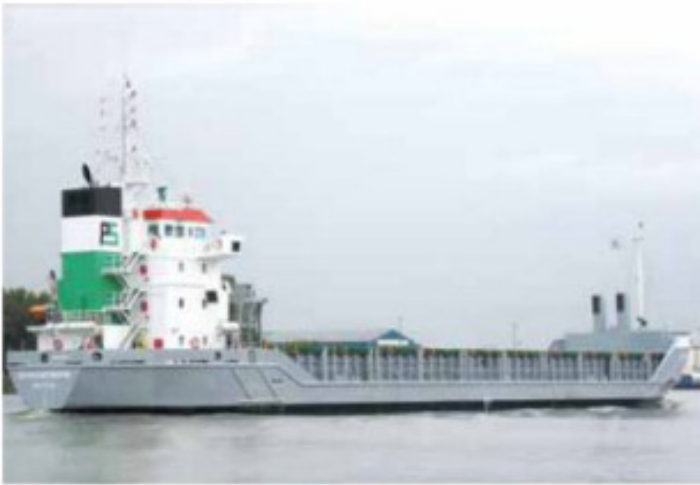
Судно для перевозки ОЯТ

После выдержки в бассейнах топливо железнодорожным транспортом перевозят на Производственное объединение «Маяк» (г. Озёрск, Челябинская область) или «Горно-химический комбинат» (г. Железнодорожск, Красноярского края), где его хранят или перерабатывают. Кроме того, ОЯТ может перевозиться морским и автомобильным транспортом.