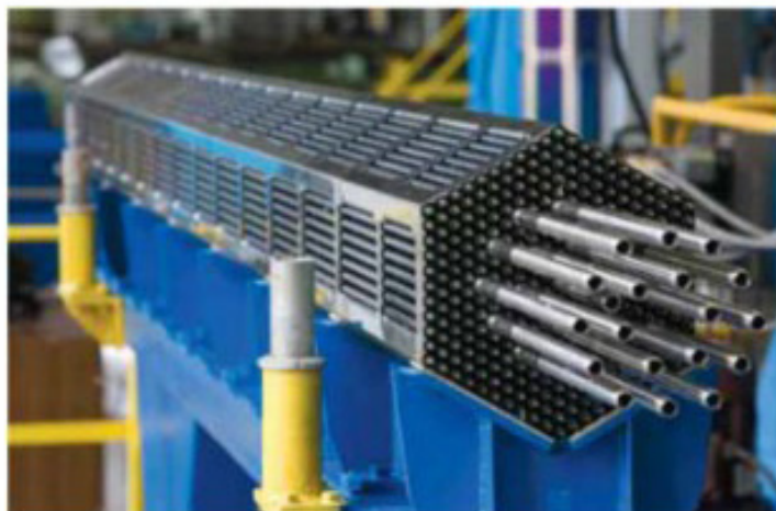
Стенд сварки каркаса ТВС

Обогащенный уран в форме UO_2 при помощи методов порошковой металлургии прессуют в таблетки диаметром порядка 1 см и толщиной 1-1,5 см. Затем эти таблетки помещают внутрь тонкостенной трубки, выполненной из циркония (чрезвычайно стойкого к воздействию высоких температур и агрессивных сред материала), содержащего порядка 1% ниобия. Длина такой трубки, называемой ТВЭЛОМ (тепловыделяющим элементом), может составлять несколько метров (для современных реакторов ВВЭР - 3,5 м). Топлива в ней – более 1,5 кг. Затем несколько ТВЭЛОВ конструктивно объединяются в тепловыделяющую сборку (ТВС).