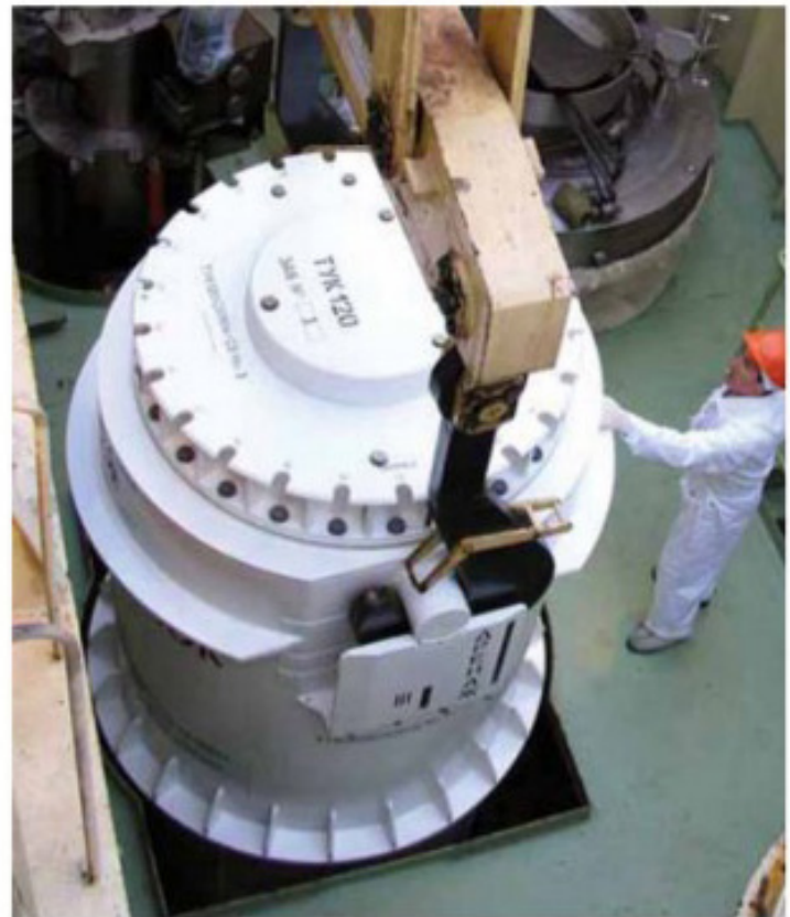
Контейнер для перевозки ОЯТ ТУК120

За всю 25-летнюю историю перевозок ОЯТ по железным дорогам России не произошло ни одной аварии со спецвагонами. Для террористов подобные перевозки также не имеют никакого интереса: взорвать вагон так, чтобы произошел выход радиоактивности, практически невозможно, а украсть контейнер с топливом, имеющий массу порядка 80-100 т – нереально.