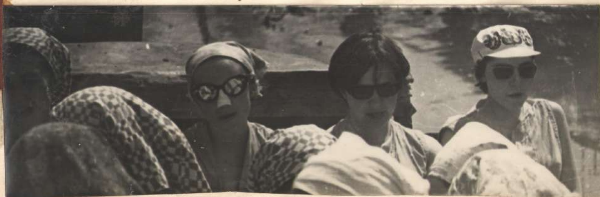
▲ НА РАБОТУ.

Вчера провели субботник, разгружали вагон с комбикормом. О, если вы никогда не разгружали этот прекрасный комбинированный корм, который употребляют в пищу все одомашненные животные, если не дышали мучной пылью, замешанной