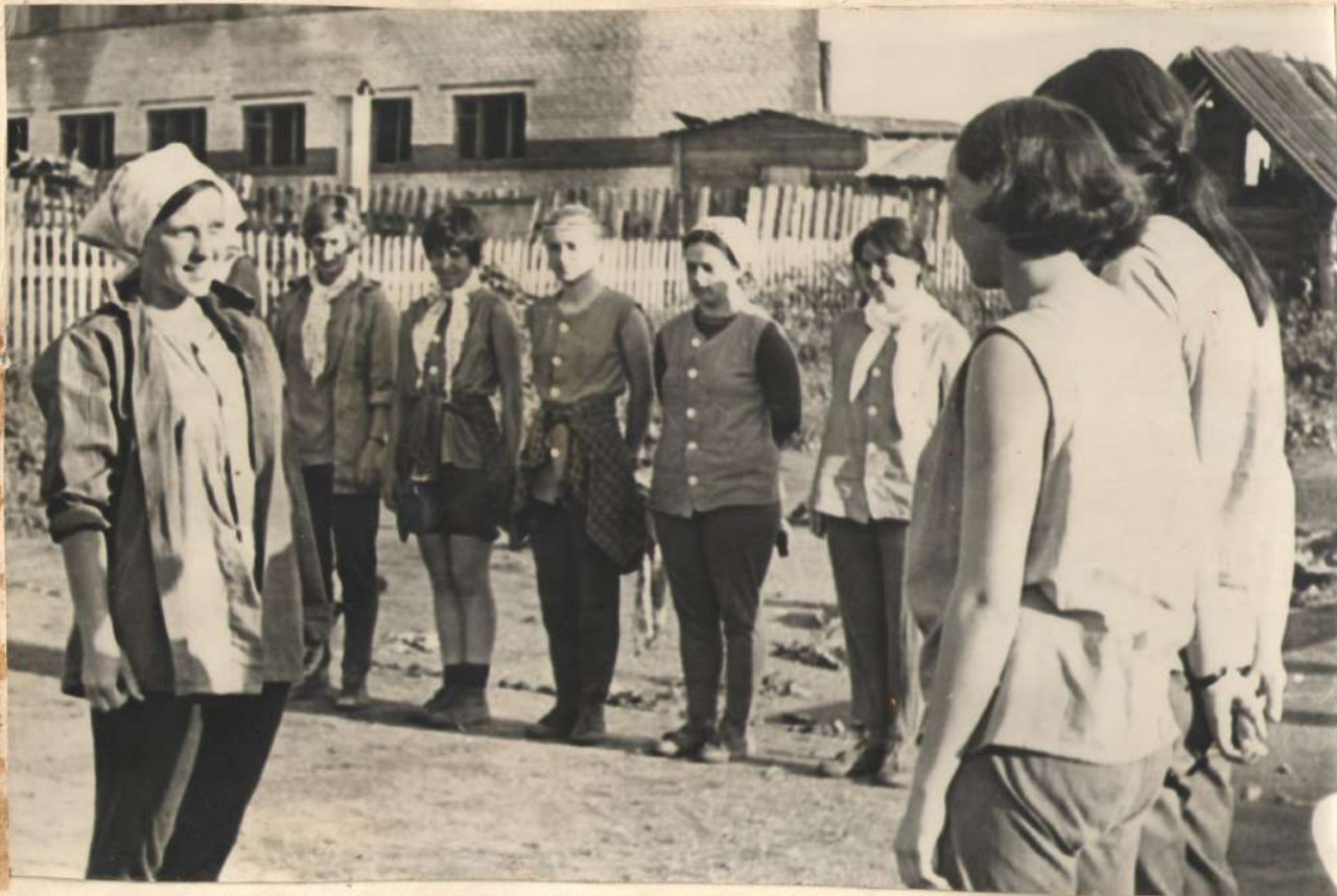
▲ НА УТРЕННЕЙ ЛИНЕЙКЕ.