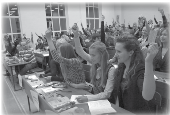
Ежегодная отчетно-выборочная конференция, где подводятся итоги прошедшего года и планируется дальнейшая деятельность ПБ.

Из рассказа одного студента: «Как-то раз студенты играли во дворе в баскетбол в футболках с надписью «ФИЗТЕХ». К ним подошла дружная компания и предложила сыграть. Сыграли. Физтехи выиграли в сухую. У них спросили: «Парни, а в каком физкультурном техникуме вы учитесь, как туда поступить?» Физтех не зря считается самым спортивным факультетом УПИ: который год мы первые в Универсиаде — общеспортивной соревновании ВУЗа.