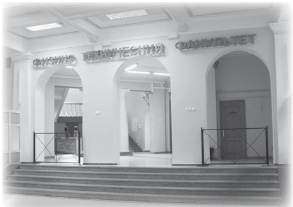
Любимый, родной и незаменимый ФИЗТЕХ!

Празднование юбилея объединило множество людей — произошла уникальная встреча поколений. Именно в такие моменты проявляется дух братства физтеха, чем и знаменит наш факультет.