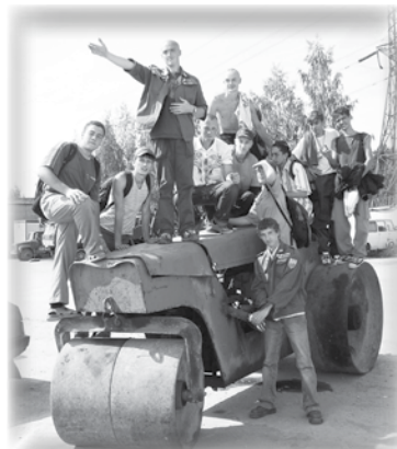
Бойцы ССО «КВАРК»