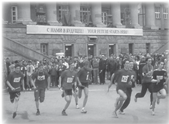
Старт смешанной эстафеты за приз газеты «ЗИК»

каждого «муравья» на слуху будут только два слова: «Весна УПИ».