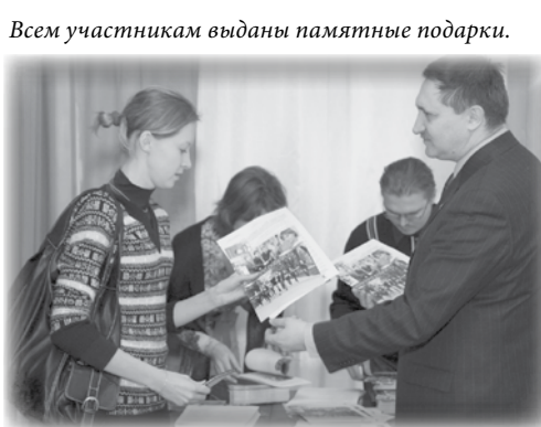
Всем участникам выданы памятные подарки.