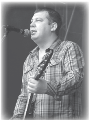
"Смысловые галлюцинации" на фестивале "Весна УПИ"

Что же это за чудо-мероприятие, которого с нетерпением ждут не только студенты, но и преподаватели? Впервые фестиваль прошёл в 1956 году под названием «Праздник весны», в котором принимали участие только студенты УПИ. Но уже в 70-х годах фестиваль получил нынешнее название. В 1959 году была организована смешанная эстафета на приз газеты «ЗИК», которая стала неотъемлемой частью всей программы мероприятия.