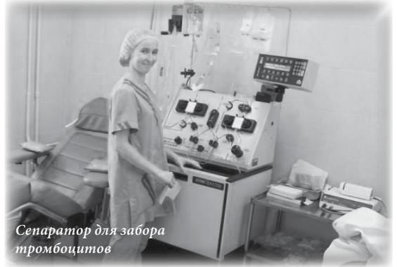
Сепаратор для забора тромбоцитов

Тромбоциты необходимы детям при проведении интенсивной химиотерапии. В принципе, одна доза тромбоцитов может быть получена из каждых 400 грамм донорской крови, но большинству детей нужно одновременно переливать несколько доз тромбоцитов. То есть для одного переливания тромбоцитов необходимо несколько доноров. При большом количестве переливаний продуктов крови от разных доноров у ребенка возрастает риск возникновения осложнений. Для снижения этого риска и увеличения количества тромбоцитов, получаемых от одного донора, предусмотрена специальная процедура — тромбоцитоферез.