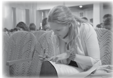
В актовом зале ГУКа проходил первый тур — тестирование.

Участвовать в стипендиальной программе не просто интересно и здорово: это открытие новых возможностей, укрепление веры в собственные силы, усиление мотивации к успеху, общение с яркими личностями, с теми, кто будет определять завтрашний день нашей страны.