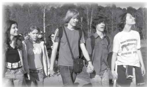
Майская прогулка. В юбилейные годы ФтФ - юбилейные маршруты. Ожидаем в этом году дистанцию в 60 км.

научной, спортивной и творческой деятельности, поделиться опытом и знаниями в практических областях науки и просто познакомиться с нашими культурными традициями и рассказать о своих.