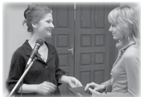
Награждение победителей — стипендиатов фонда В.Потанина