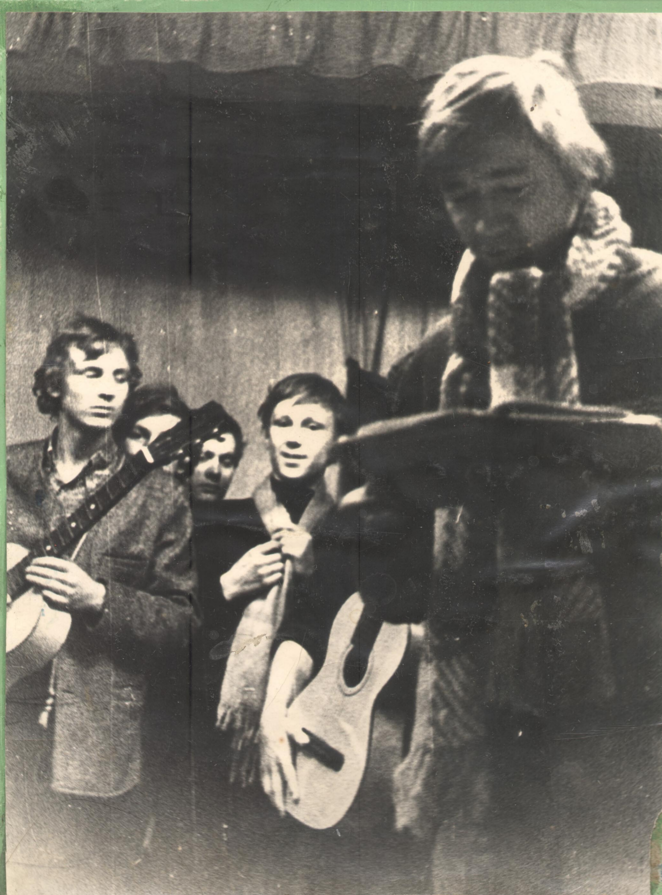
КВН в "УПИ-весна".