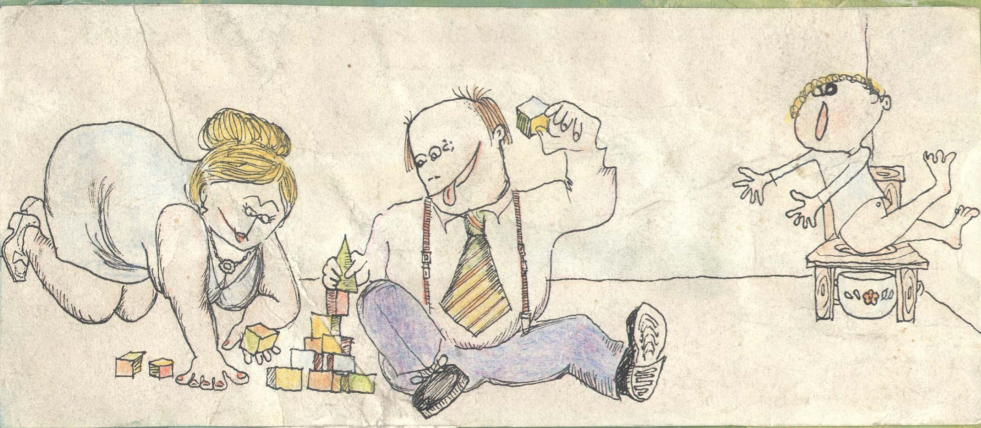
Общественные организации ФТФ сделали всё возможное, чтобы бурная волна празднования победы пронесла студентов на своём гребне мимо...