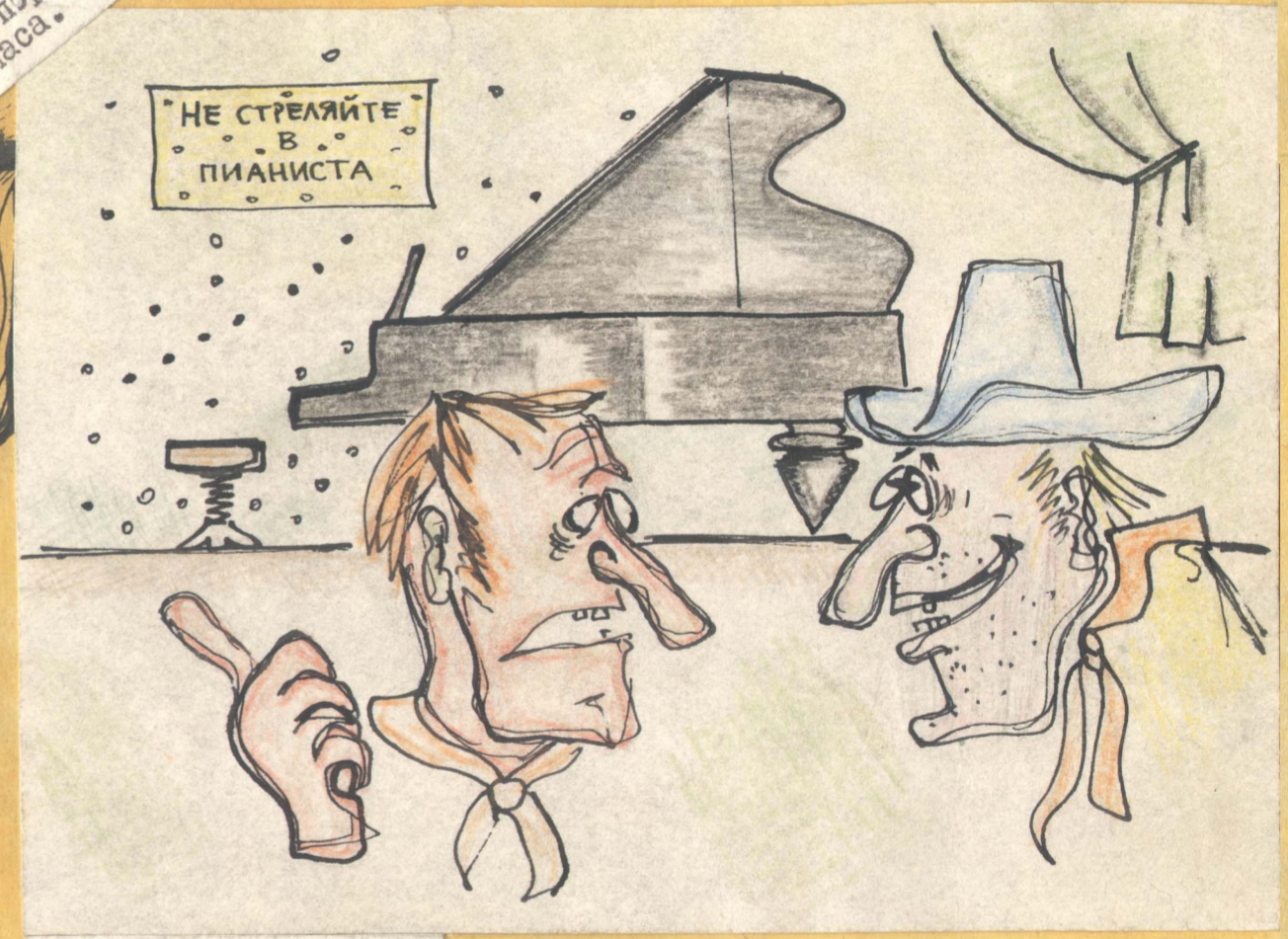
-А где пианист? -Доигрался...