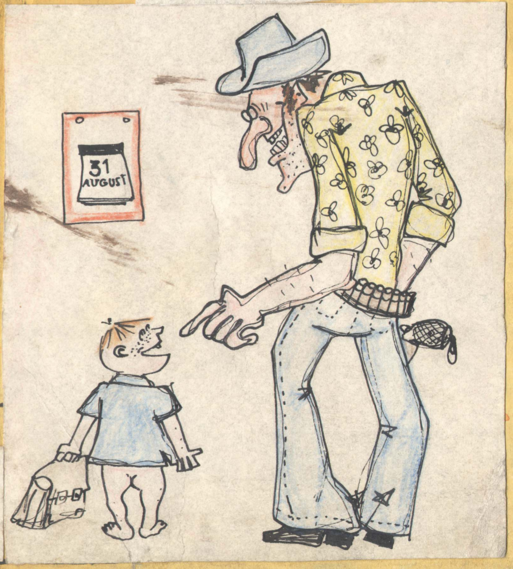
-Папа! Мне нужны штаны, я иду в школу. -Обойдешься!