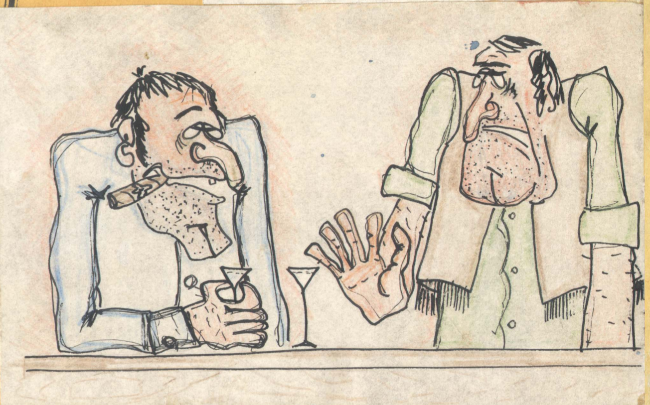
-Билл! Нет! -Первую пропускаю.