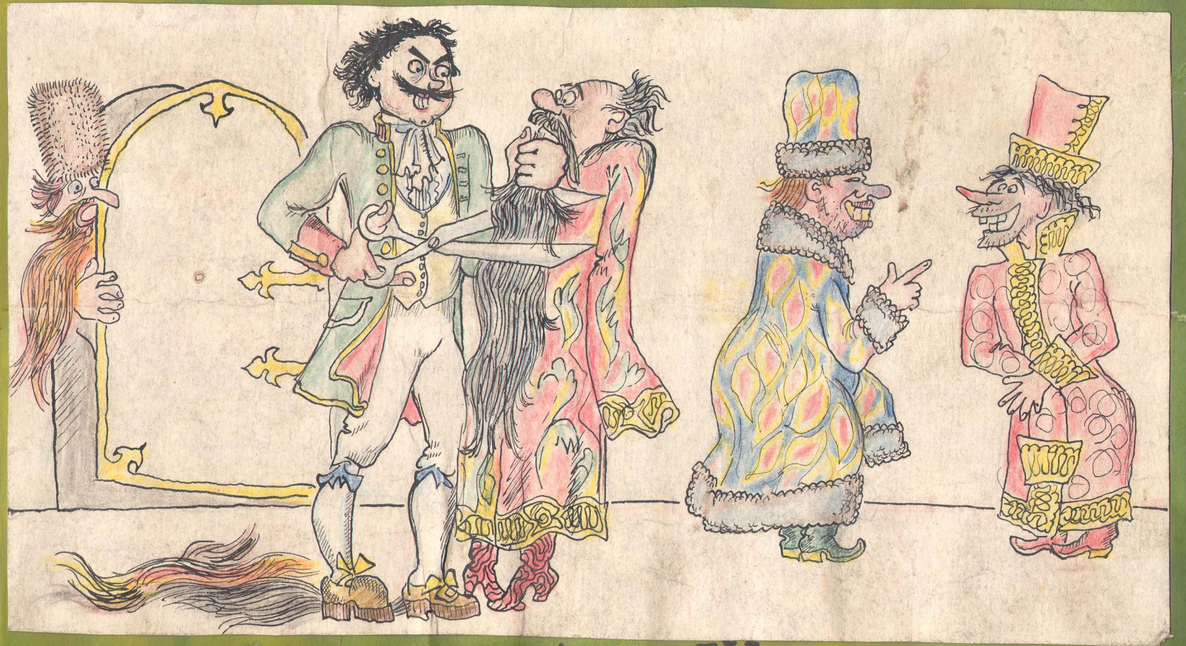
- Я ВАС ВСЕХ НА АТЛИЦКИЙ МАНЕР!!!

Следуя замечаниям праздничной комиссии, партийное бюро факультета приняло смелое решение: уравнивать размеры планшетов в целинной галерее для исключения выделения как в лучшую, так и в худшую стороны.