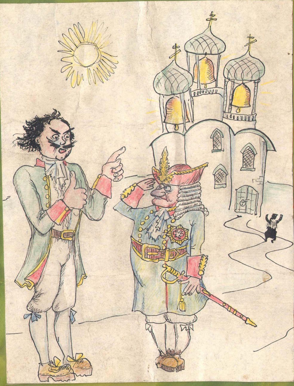
- СКИ ОРЛА НА ПУШКИ ЗЕЛО БОРЗО!

Острая нехватка стройматериалов снова ограничила трудовые успехи наших ССО.