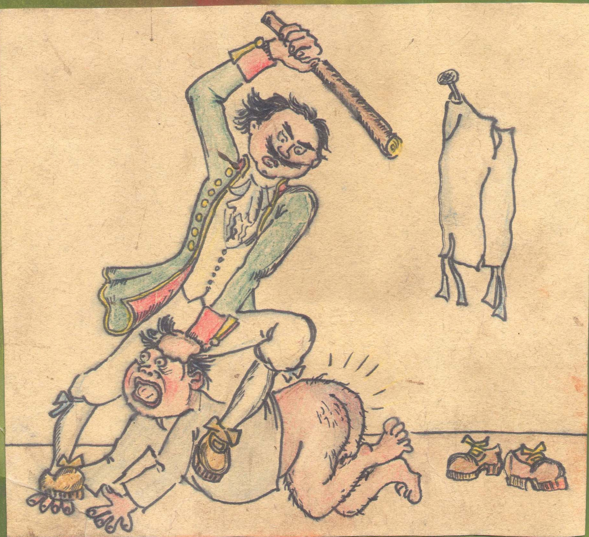
- НЕ БУДОШЬ, СУКИН СЫН, СЫН КОЛОТОВ УКОЛОНЯТЬСЯ!!!

Больших усилий стоило руководству обеспечить (хотя бы на малом) массовый выезд бойцов ССО на сельхозработы.