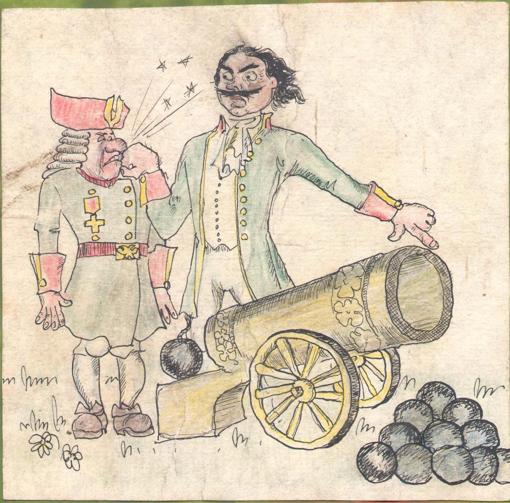
- КТО УЧИЛ ОРУДИЮ ЧЕРЕЗ ЗАД ЗАРЯЖАТЬ, О! В ДУХА НАДОБНО!

Отсутствие профессиональных навыков у бойцов ССО частая причина нарушения ТБ.