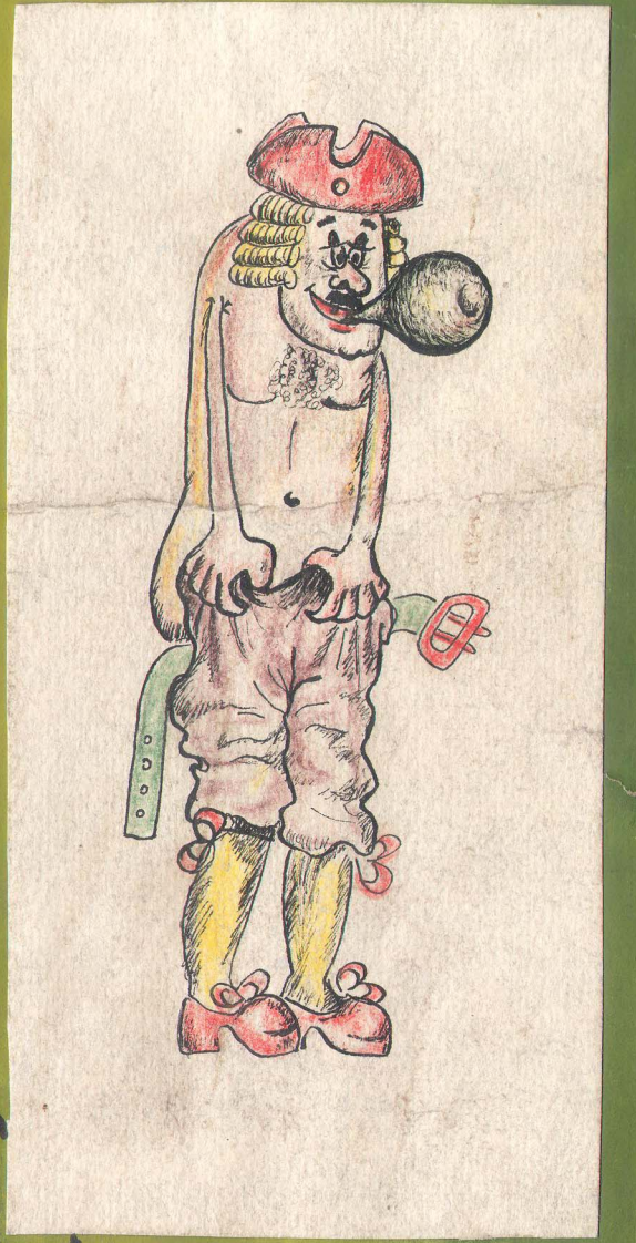
Бойцы ССО "ПЛАНЕТА" умудрились выехать на целину не получив положенных прививок.

ССО крайне не хватает строительной техники.