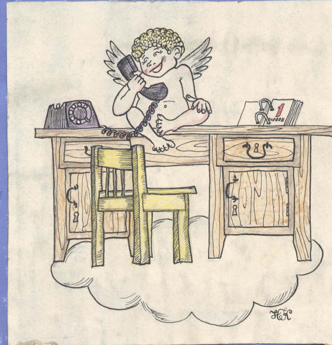
- БОГА НЕТ!