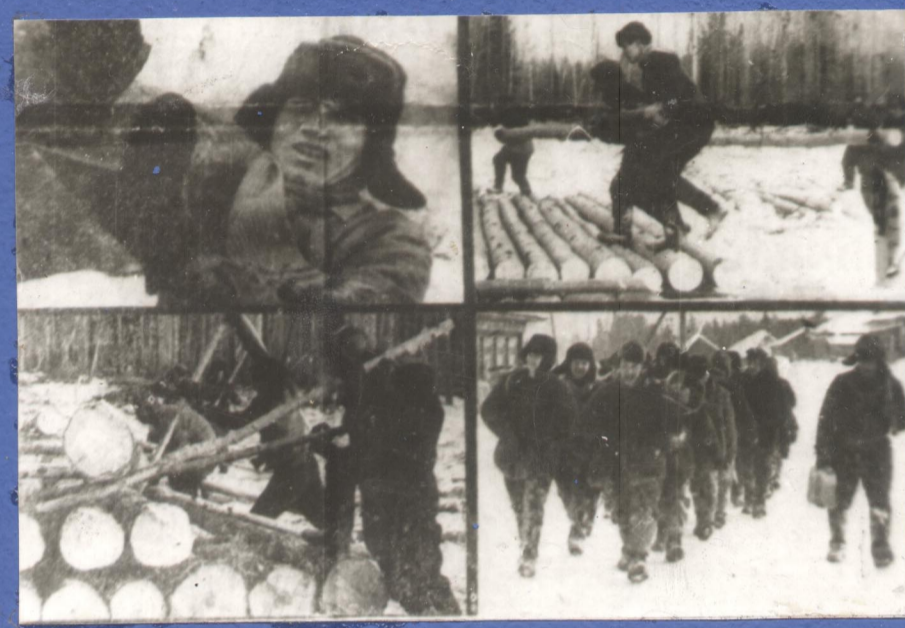
Бойцы отряда «УПИ-Мезон» в 1967 году.