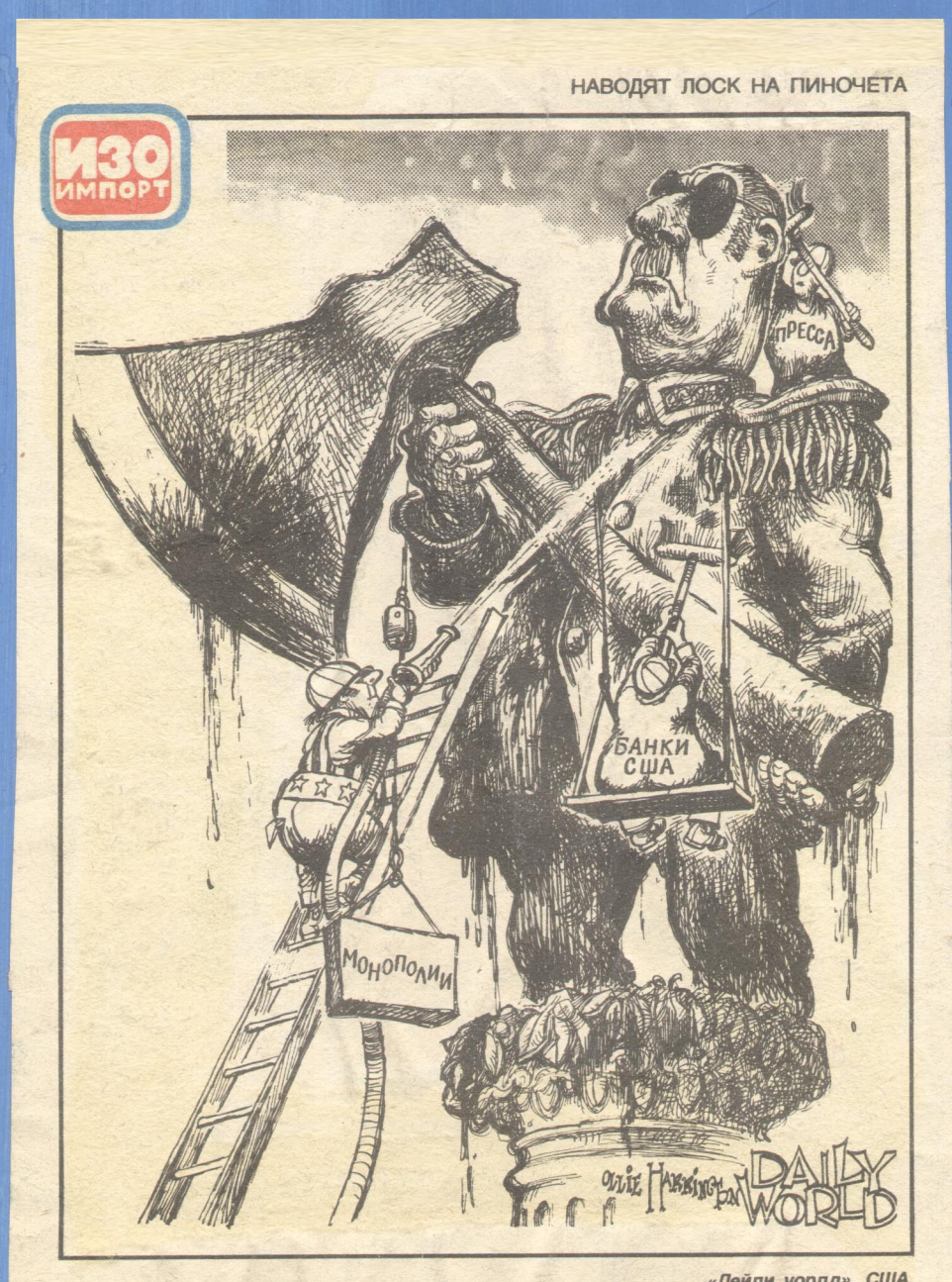
НАВОДЯТ ЛОСК НА ГИНОЧЕТА «Дейли уорлд», США.