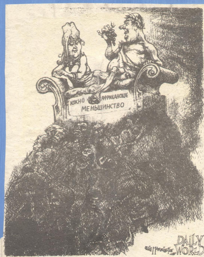
— Как видите, дорогая, мы находимся на вершине цивилизации. «Дейли уорлд», США.