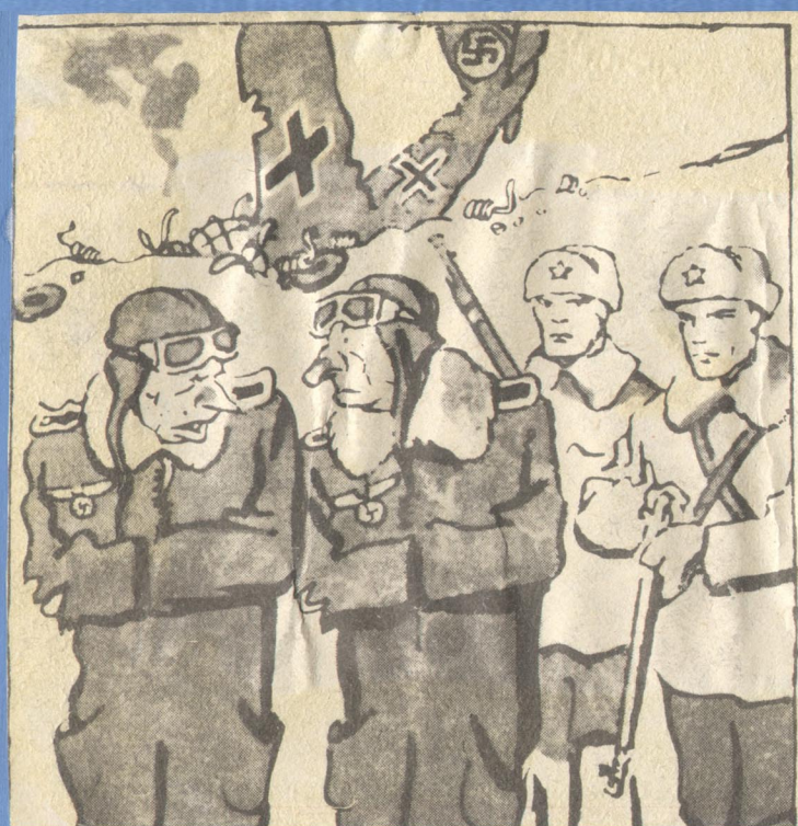
УВАЖИТЕЛЬНАЯ ПРИЧИНА — Вы добровольно сдались в плен, господин обер-лейтенант? — Нет, нас на это подбили русские. Рисунок А. БАЖЕНОВА, 1947 г.