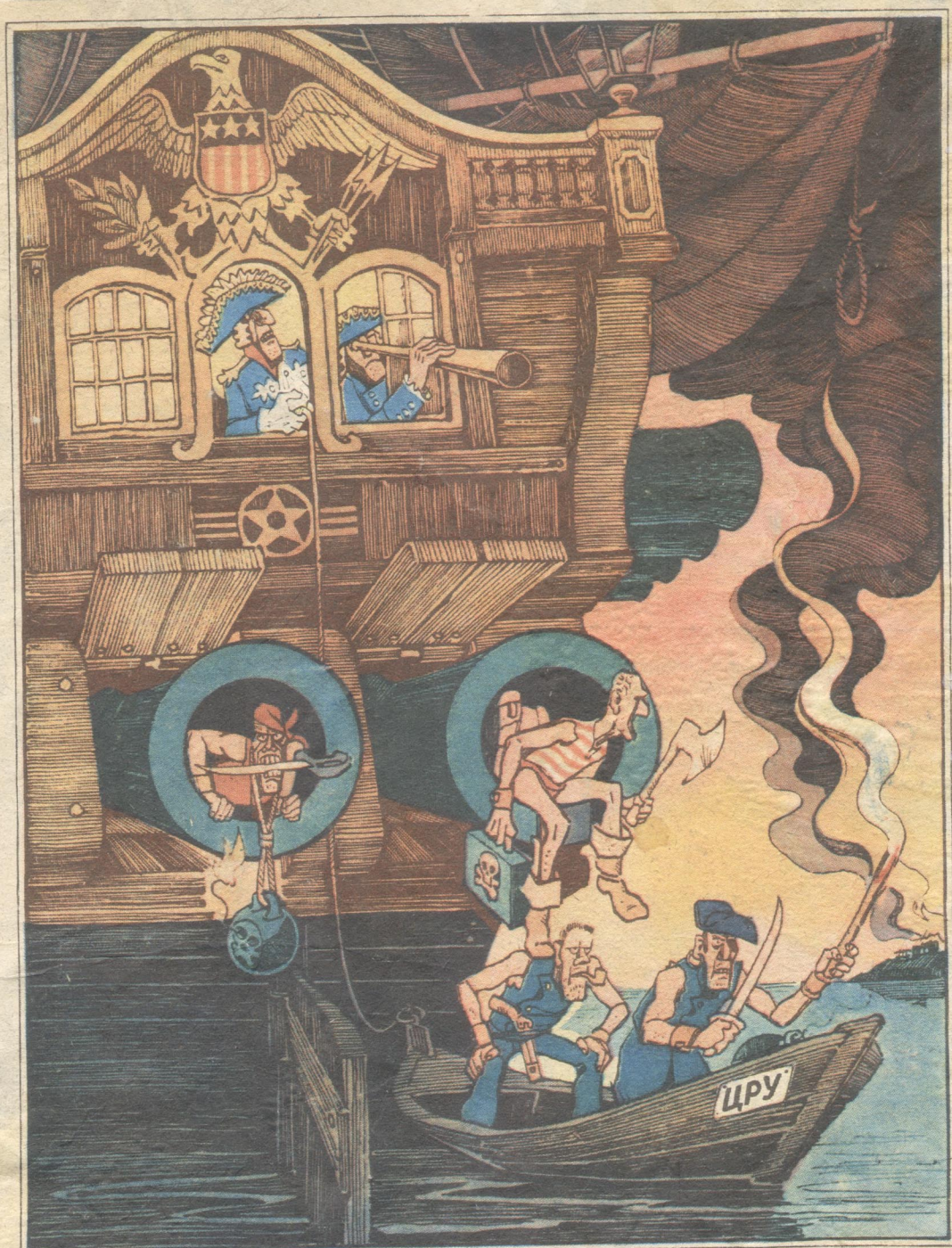
КАРИБСКИЕ ПИРАТЫ: — Пока наши пушки молчат, нас никто не сможет упречь в развязывании войны против Никарагуа. «Океанист», ГДР.