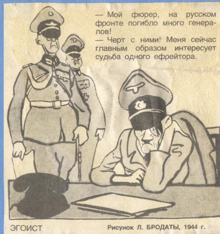
ЭГОИСТ Рисунок Л. БРОДАТЫ, 1944 г.