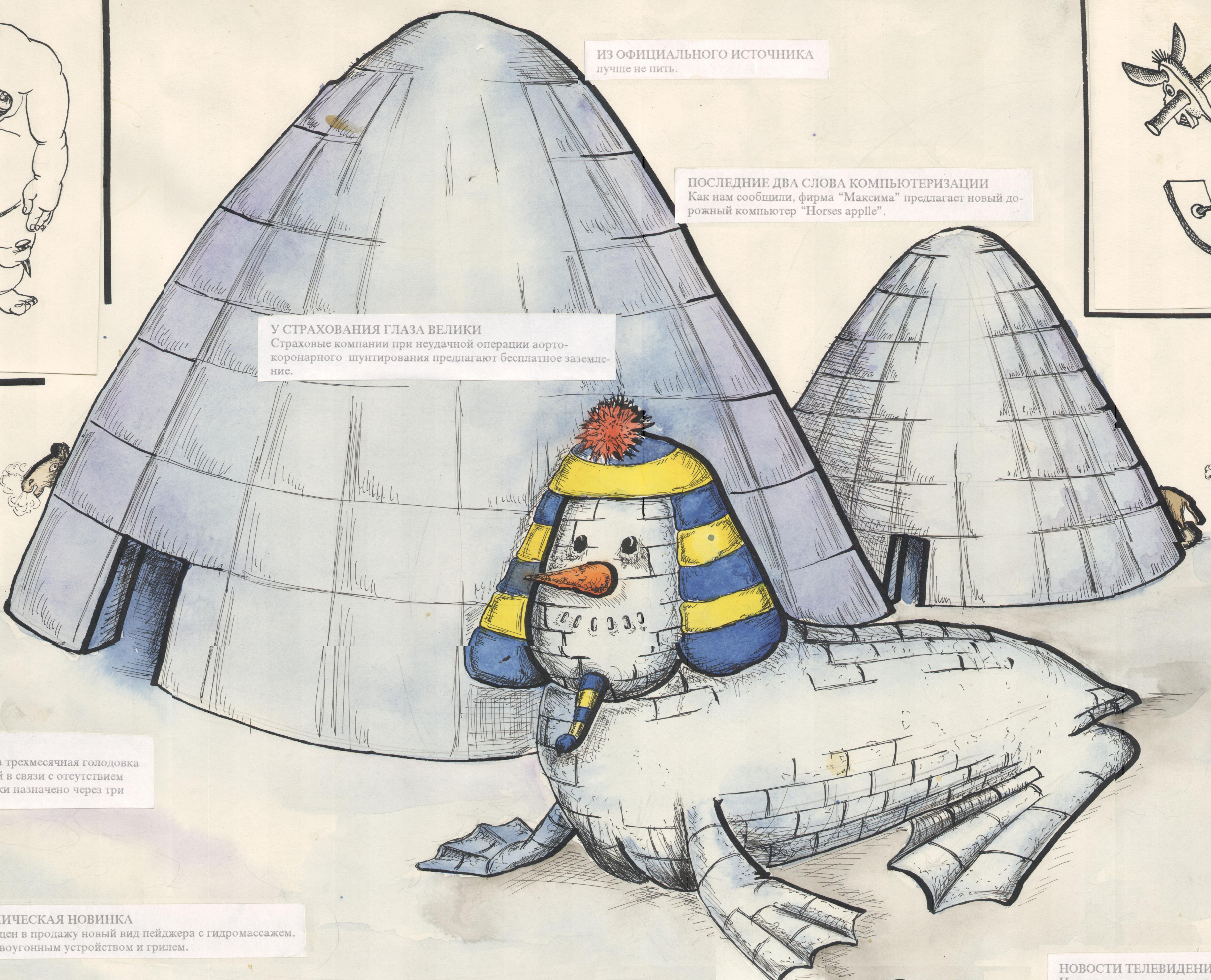
ПОСЛЕДНИЕ ДВА СЛОВА КОМПЬЮТЕРИЗАЦИИ Как нам сообщили, фирма "Максима" предлагает новый дорожный компьютер "Horses apple".