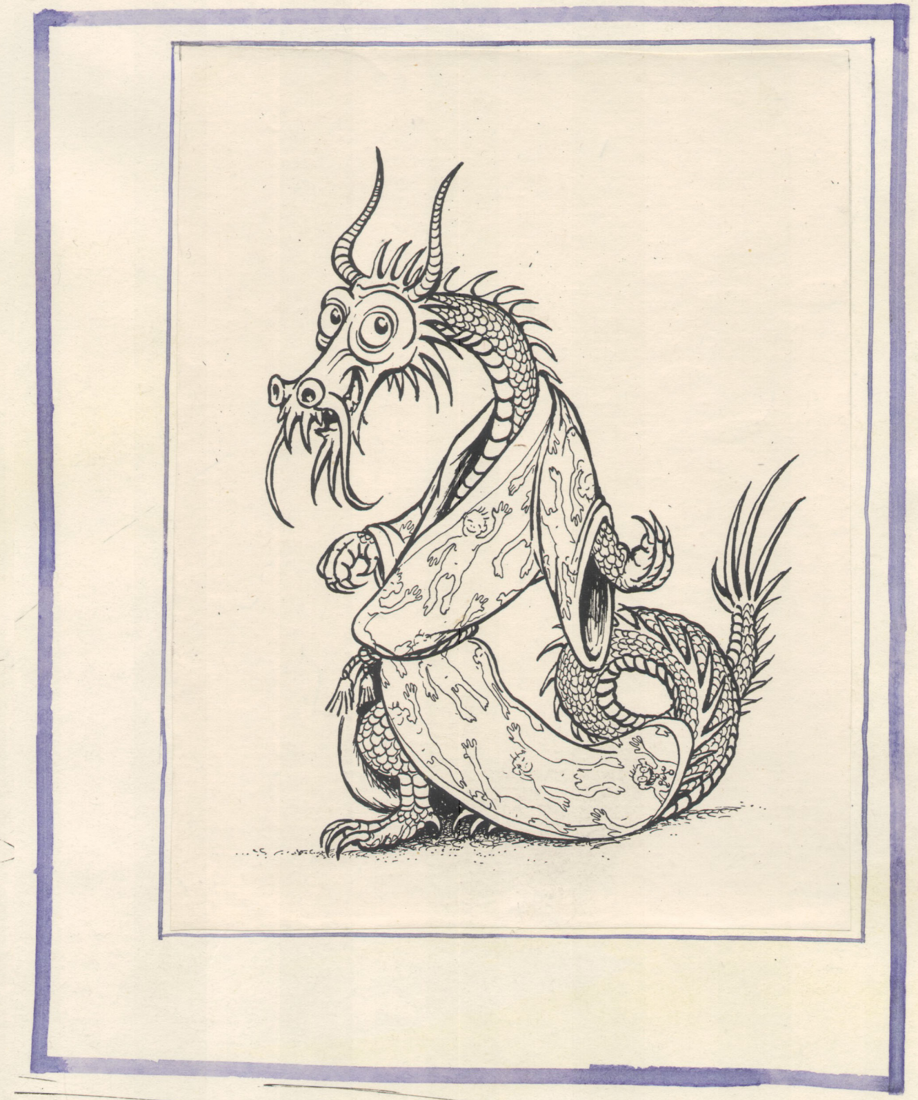
ЗАПАЛ В ДУХУ а вся гравята не влезла.