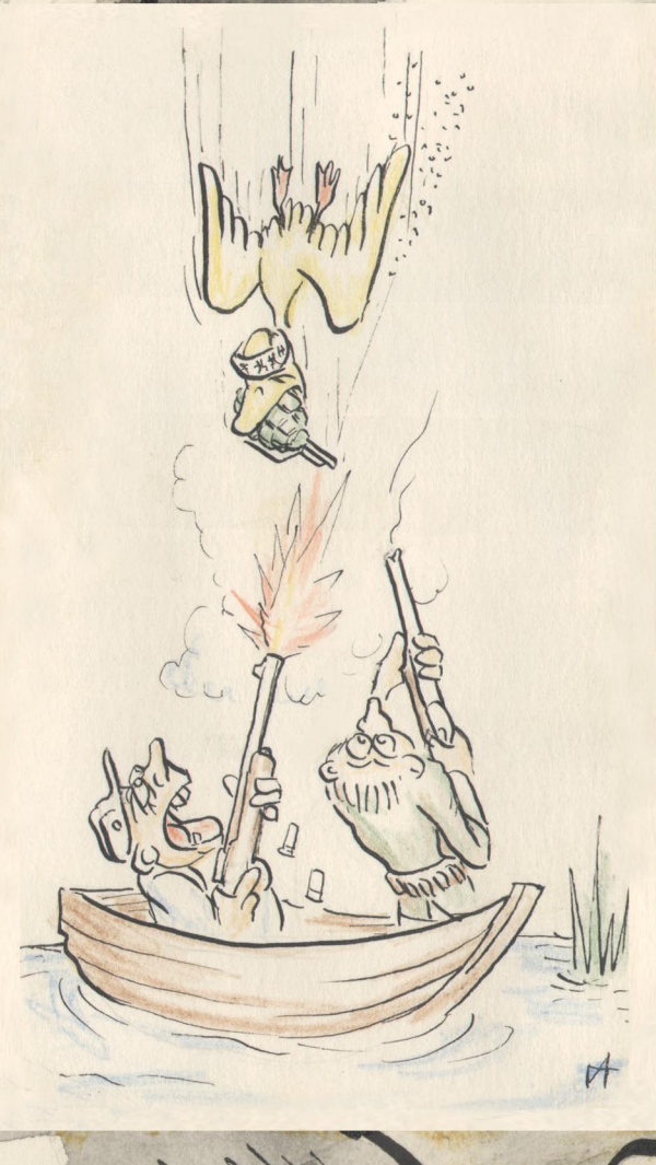
КИНОАФИША "Белый бил в чёрное ухо"

КАПИТАНСКИЙ КОСТИК собран из капитанских диодов